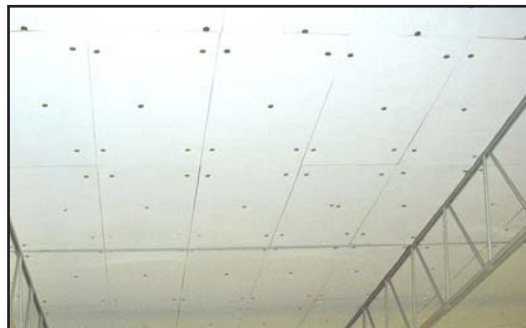
montert i tak